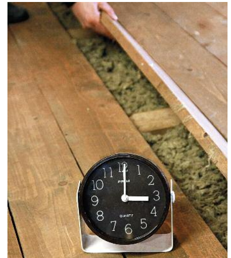
Uzavření dutého stropu

Právě jaro je ta nejpříhodnější doba pro nápravu škod a pro zvýšení komfortu bydlení. Například pořídit ony nové izolace. Proč kupovat kožich v létě? To je přece jasné. Firmy startují sezónu, sestavují harmonogramy zakázek. Nabízejí nejen předsezónní slevy, ale mají hlavně spoustu volných termínů a velmi dobré podmínky. Dbejte však na kvalitu. Jak materiálu, tak i práce. Zapomeňte na garážové firmy a kamarády z hospody. Nejlépe co do poměru ceny a kvality vychází izolace