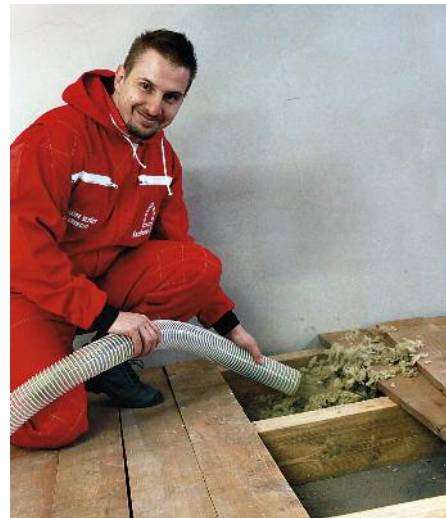
Vyplnění dutého stropu izolací MAGMARELAX®

Zateplení rovné střechy je nejhodnější provádět v létě. Jedná se totiž o střechy,