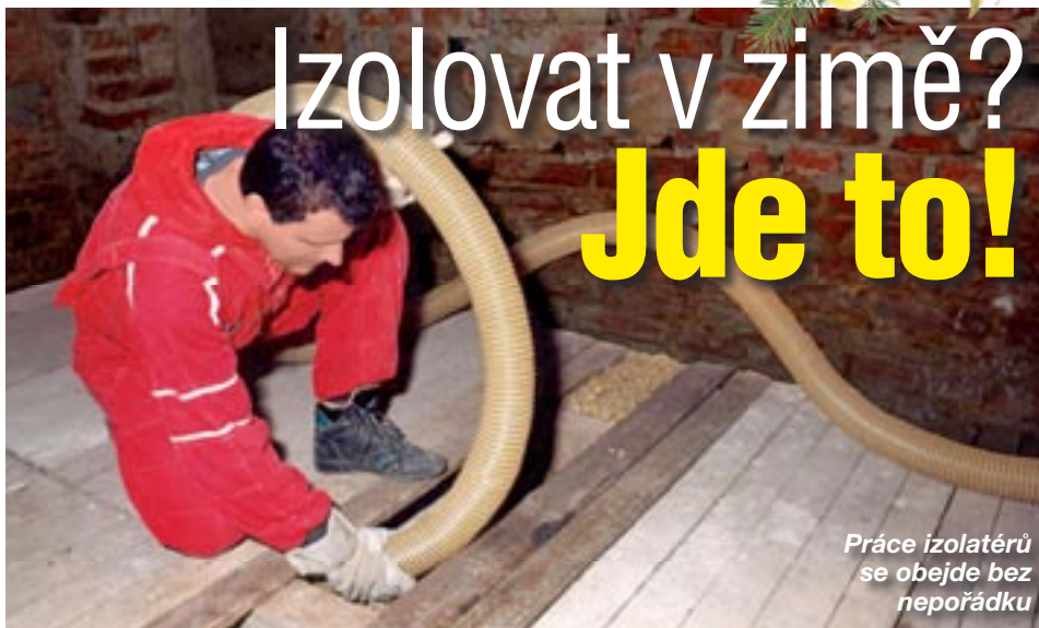
Práce izolátorů se obejde bez nepořádku

Není mnoho stavebních prací, které lze provádět za špatného zimního období. V oblasti zateplení a při realizaci dalších úsporných opatření to platí dvojnásob. Jinak je tomu ovšem v případě zateplení stropu domu foukanou minerální izolací.