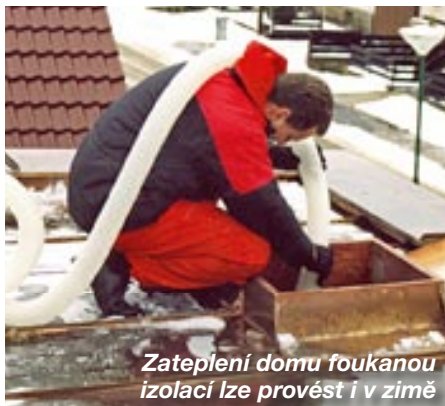
Zateplení domu foukanou izolací lze provést i v zimě

Určitě se proto vyplatí co nejdříve navštívit webové stránky www.ippolna.cz a nezávazně se informovat nebo využít bezplatnou telefonickou linku 800100533 , kde nám ochotně poradí. ■